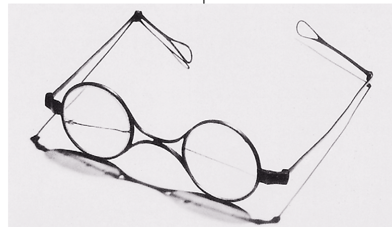
Schuberts Augengläser Schubert's eye glasses

gige Taschenpartituren kommen leicht auf das Doppelte der Seitenzahl. Entsprechend groß ist die Spieldauer – je nach Tempowahl und Berücksichtigung von Wiederholungen kommen die Werkaufführungen auf mindestens eine knappe Stunde.