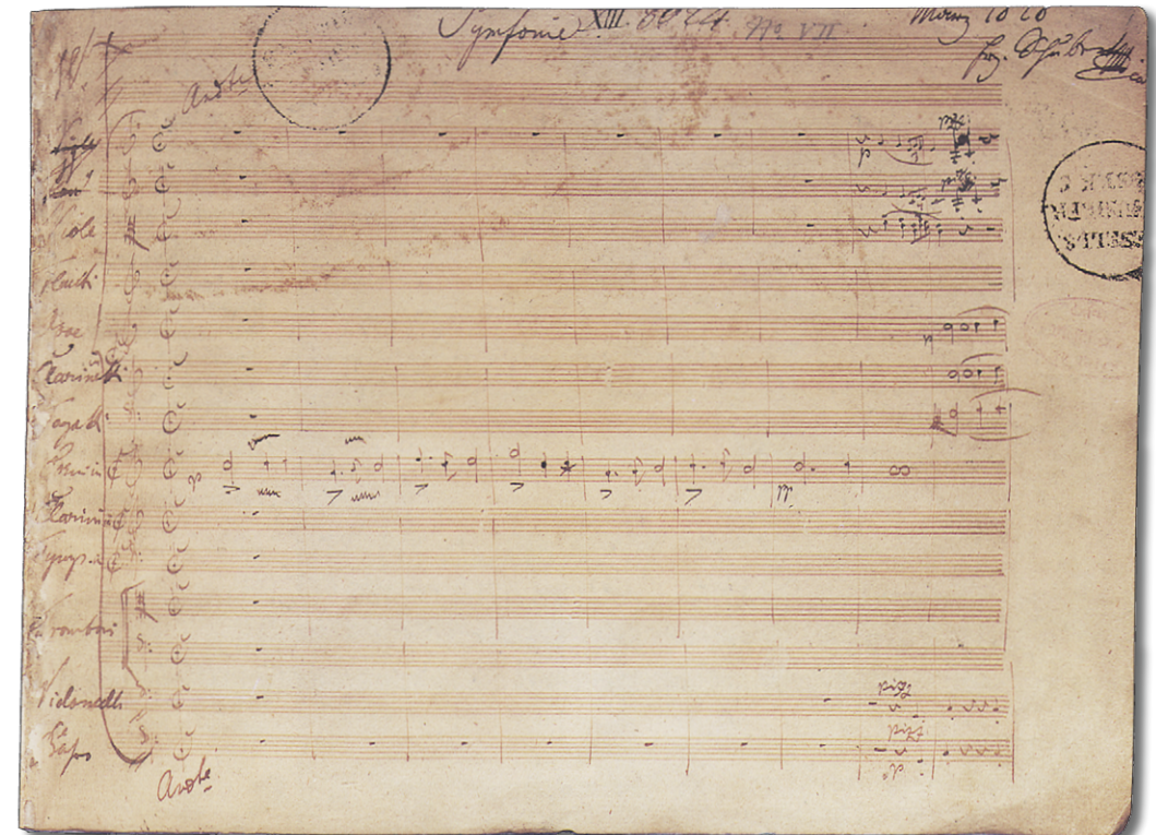
Autograph of the beginning of the Symphony in C Major D. 944 Autograph des Beginns der »großen« C-Dur-Sinfonie D 944

it in 1934; his efforts were preceded by those of the English pianist and composer John Francis Barnett, whose version dates to the early 1880s). The series also includes the above-mentioned “Unfinished” from the fall of 1822, which was finally given its first performance in 1865 and then enjoyed a highly remarkable reception and enormous esteem. The fact that only two movements were completed did not diminish the work’s triumph: the genuine lyrical tone, rich in nuance and so very different from Beethoven, almost an alternative to the stringent design of the latter’s symphonies, made the “Unfinished” seem attractive—and at the same time a harbinger of the monumental symphonic style of Bruckner and Mahler. In this context, two symphonic fragments must be mentioned: the Introduction and Allegro D. 615 written after the Symphony No. 6 in 1818, as well as a torso numbered D. 708, which was