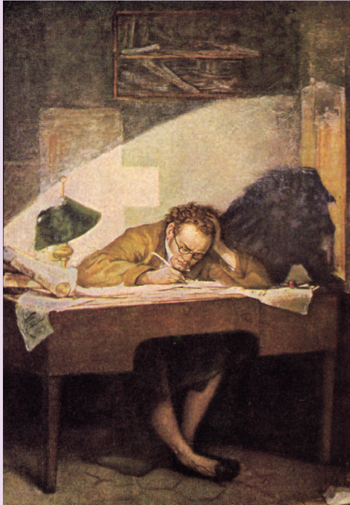
Franz Schubert komponierend

Ölbild von Carlo Bacchi aus dem Pariser Salon , 1929 Oil painting by Carlo Bacchi from the Pariser Salon , 1929