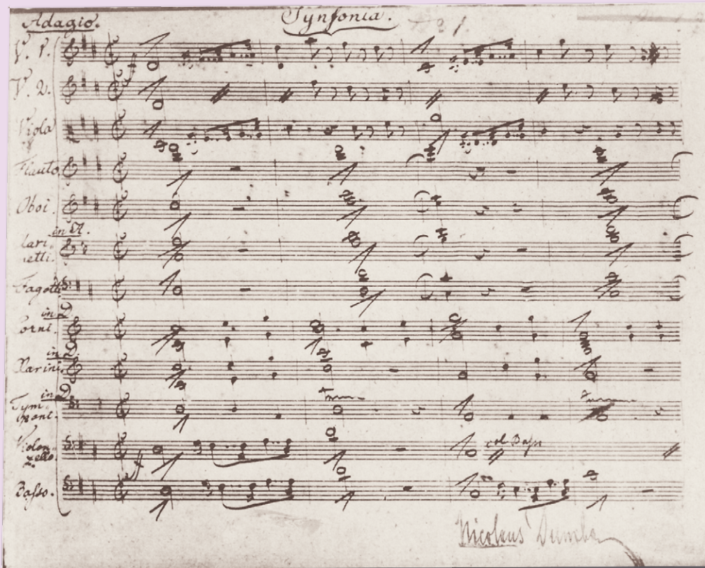
Autograph der Partiturseite der 1. Sinfonie D-Dur D 82, Oktober 1813

Autograph of the first score page of the Symphony No. 1 in D Major D 82, October 1813